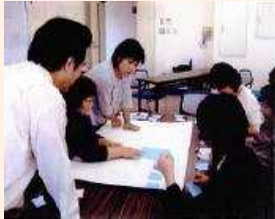
課題について意見交換