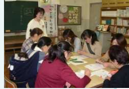
学校等を活動拠点に支援内容を検討

【チーム員構成例】 子育てサポーターリーダー、 元教員、民生・児童委員、 保健師 等