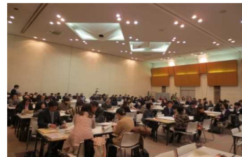
ワールド・カフェ形式のワークショップ