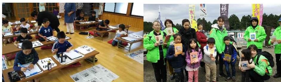
子供倫理塾の様子

子供たちの自主性が伸ばせるよう、できるだけ子供たちをメインとした活動をしています。