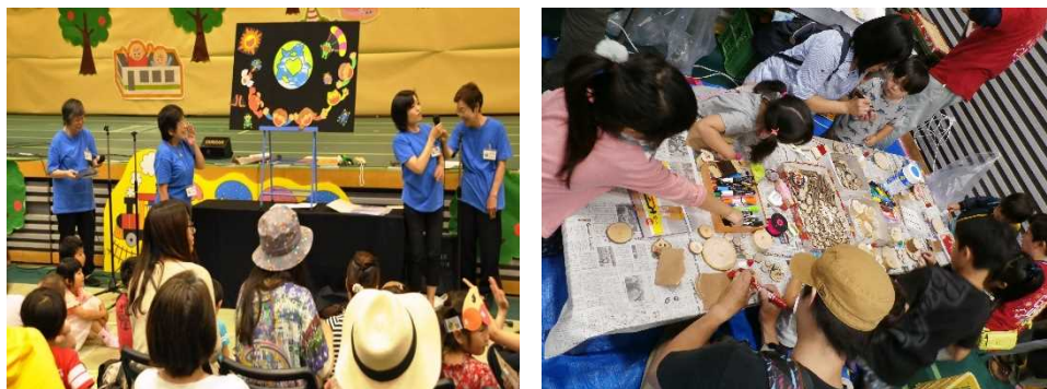
▲ステージイベント(読み聞かせ講座) ▲工作ができる出展ブース