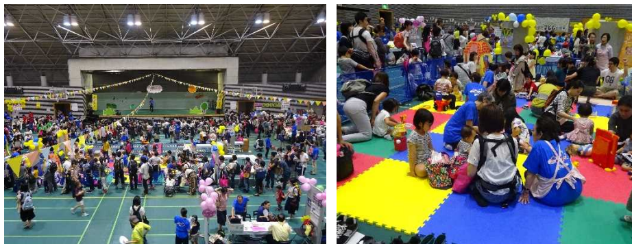
▲会場の様子(H30年度 来場者約 2,500人)