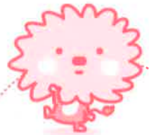
光のまち・阿南市のイメージアップキャラクター あななん

「この子、大丈夫かしら」 「こんな子育てでよいのかしら？」 ちょっと心配な方、迷っている方、あなたの不安解消のために、どなたでも、お気軽にご相談ください。相談内容は秘密厳守します。