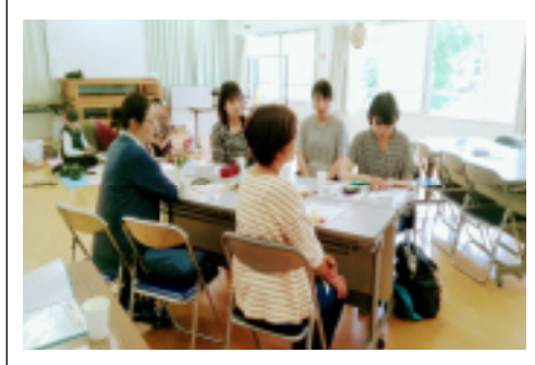
子育てセミナーの様子

なかなか他の人には聞かれたくない悩みなどもありますので、別途、個人相談も受け付けています。