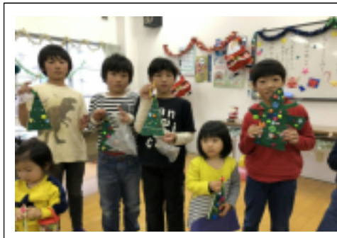
子供倫理塾の様子