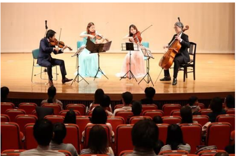
コンサートの様子

年に1度、乳幼児向けのコンサートを開催しています。家族で本格的な音楽会を体験する機会を提供し、親子のきずなを深めることや子どもの豊かな心と感性を育むことを目的として実施しています。