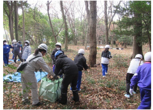
中高生が雑木林の清掃をしている様子

主に中高生を対象としており、毎年12月に地域の方々といっしょに市内の雑木林において、ボランティア活動や自然体験活動を実施しています。この活動を通じて、異年齢交流が図れるとともに、中高生の力を地域に還元することができます。