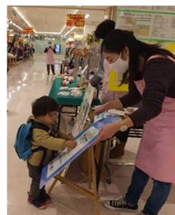
自分でも貼れるよ～