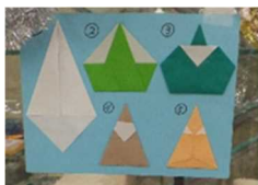
サンタの折り方説明