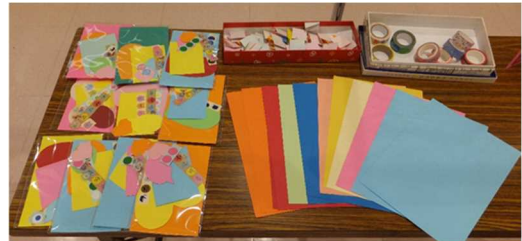
選べるカード作り