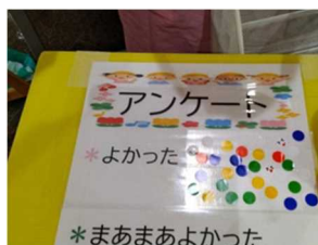
短時間のアンケート