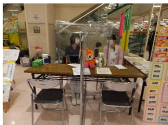
歯科衛生士さんの相談