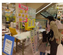
引越してきたばかりのママに子育て情報の提供