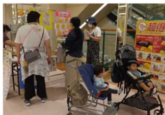
情報コーナーで友達に