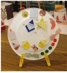
シールを貼って 出来上がり！！