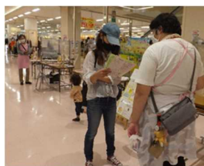
井戸端会議の様に気軽に相談