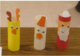
トイレットペーパーの サンタ・トナカイ