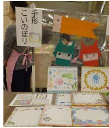
手形とこいのぼり作り