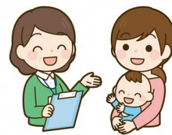
傾聴で解決できない問題は、専門機関を紹介