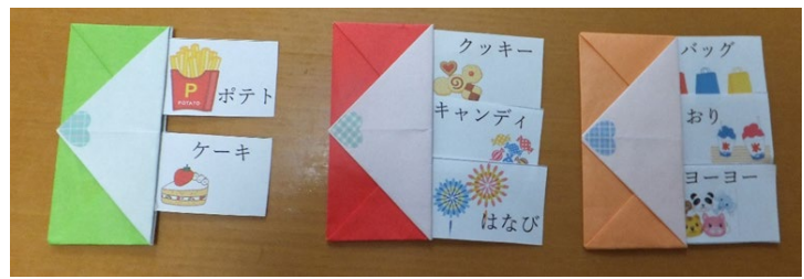
夏祭り参加券(ポテト・ケーキ・クッキー・キャンディ・はなび等)