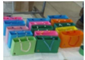
買い物バッグ (好きな色を選ぶ)