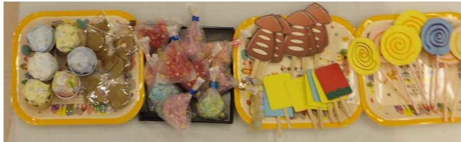
ごっこ遊び(カップケーキ・綿菓子・イカ焼き・アイスクャンディ・キャンディ)