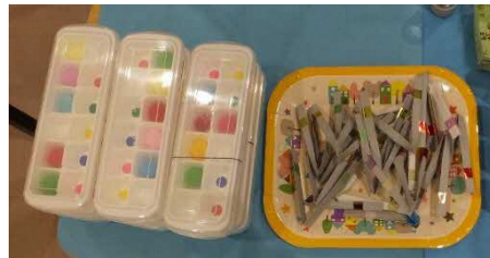
カラーボール (知育おもちゃ)