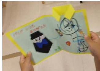
作品(父の日のカード)