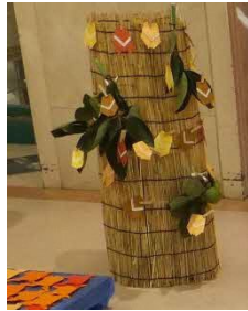
どうぶつ探し (セミを見つけます)