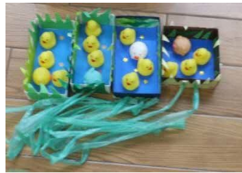
運動会のアヒルのザル引き