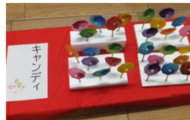
(折り紙のキャンディー)