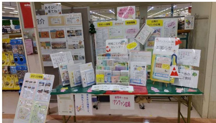
アル・プラザ茨木の常設子育て情報コーナー