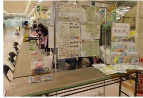
II イオンモール茨木(2023年度)