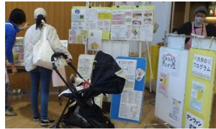
子育て初めてのママに情報の提供