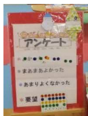
シールを貼ってもらいながら話を聴く(短時間のアンケート)