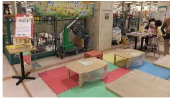
I、アル・プラザ茨木(2023年度)