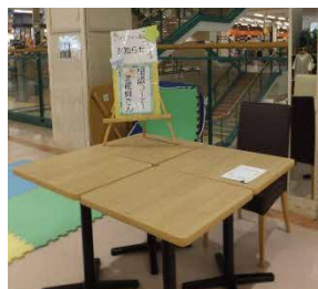
歯科衛生士さんの相談