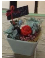
母の日のアレンジ (自分へのご褒美)