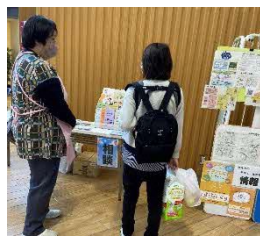
情報コーナーで世間話