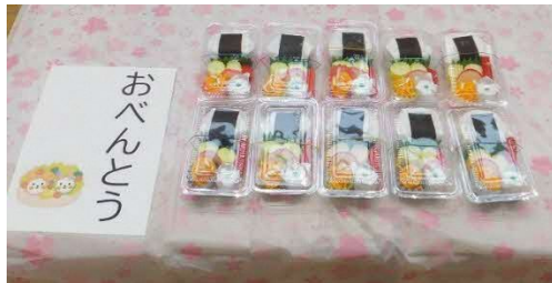
ごっこ遊び(おべんとう)