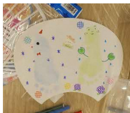
作品(手形のうちわ)