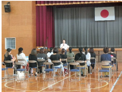
（チーム員より開催の目的を説明）

福川小、福川南小学校で開催される就学時健康診断にチームも参加し、健診の空き時間を活用し、保護者向けの座談会を企画、開催している。