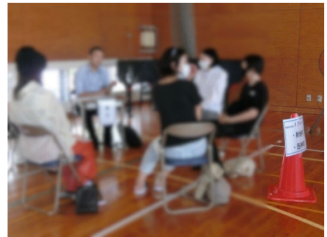
（居住地に分かれ座談会実施）