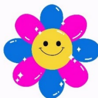
チームのロゴマーク 「きくがわスマイル」

地域学校協働活動推進員を中心として、令和2年度にチームとして発足。発足と新型コロナウイルス感染症の流行が重なったが、「今できることを！」という思いから、地域内の全家庭にチーム紹介のチラシを配付するなど、できることから一步一步活動に取り組んでいる。