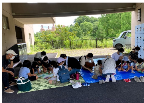
「親子で紙飛行機を作ろう」